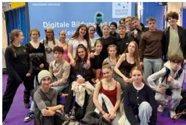
Am 28. März informierte sich die Klasse 9a bei der Leipziger Buchmesse über digitale Bildung. Aber auch die anderen Angebote wurden von Jugendlichen genutzt und besonders die jugendgemäßen Angebote am Infostand des Bundestages gelobt.