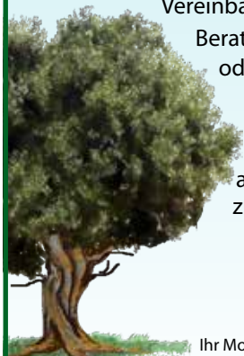
Ihr Moshe Oppenheimer

Vereinbaren Sie einen unverbindlichen Beratungstermin in unserem Büro oder bei Ihnen. Als Delegierter des JNF-KKL berate ich Sie vertraulich in Erbschaftsangelegenheiten zugunsten Israels.