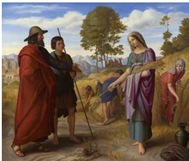
Julius Schnorr von Carolsfeld: Ruth im Feld des Boaz

Und Abraham, zu diesem Zeitpunkt bereits fast ein 100-jähriger, kurz nach seiner Beschneidung, hatte nichts Besseres zu tun, als mit Gott eine Diskussion anzufangen, um diese Städte zu retten. Er fragte Gott, wie viele Gerechte nötig seien, um eine Stadt vor der Vernichtung zu bewahren. Und so ging die Diskussion zwischen Abraham und Gott immer weiter, die Zahl der Gerechten wurde immer geringer in ihrer »Verhandlung«. Doch entkommen konnte zum Schluss nur Lot mit seiner Frau und seinen Töchtern, die sich