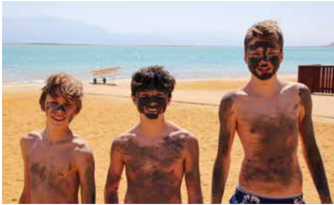
oben: Erholung am Toten Meer

Die Israelreise der 8. Klassen des Jüdischen Gymnasiums