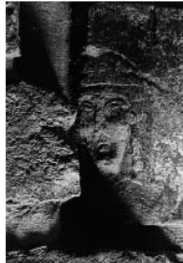
Erfurter Mikwe, 13. Jahrhundert. Bis 8. Januar ist in der Alten Synagoge außerdem die Foto-Ausstellung »Ganz rein! Jüdische Ritualbäder« mit Fotografien von Mikwaot aus ganz Europa von Peter Seidel zu sehen