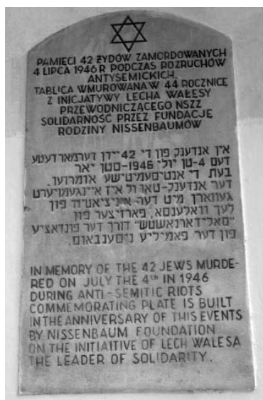
Gedenktafel am Haus Plantystraße 7

und Nachbarn ein Horrormärchen von einem angeblichen Fremden, der kein Polnisch sprach und ihn in einem Keller festgehalten hatte. Der Verdacht fiel sofort auf die Bewohner des sogenannten »Judenhauses« in der Plantystraße. Dass das Haus gar keinen Keller hatte und das Kind unversehrt war, störte niemanden und die Ritualmordlegende machte schnell die Runde, zumal das Kind seinen angeblichen Entführer identifizierte. Daraufhin fiel am 4. Juli der Mob, flankiert von bewaffneten Soldaten und Polizisten, mehre-