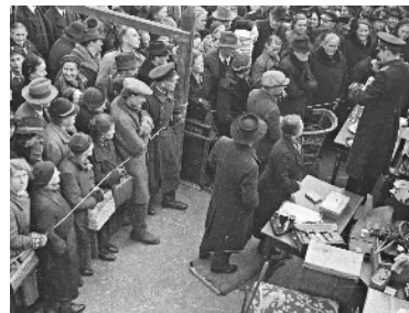
Publikumsandrang bei der Versteigerung des Eigentums der Deportierten

„bis 8. Januar, tägl. 10–20 Uhr Stiftung Topographie des Terrors Niederkirchnerstraße 8 | 10963 Berlin