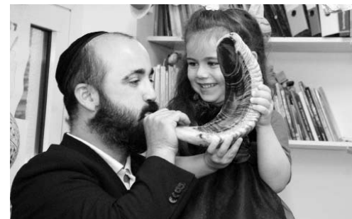
Rosch Haschana in der Galinski-Schule und im jüdischen Kindergarten M. SCHMIDT