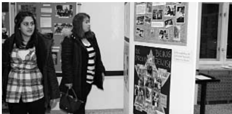
Schüler und Schülerinnen der Jüdischen Oberschule beteiligten sich an dem Wettbewerb »denk!mal« des Berliner Abgeordnetenhauses, der jedes Jahr anlässlich des Gedenktages für die Opfer des Nationalsozialismus am 27. Januar stattfindet.

_Bei schulischen Problemen aller Art berät das Mitglied des Schulausschusses, Studiendirektorin Jael Botsch-Fitterling Schüler und Eltern nach Vereinbarung, T. 832 6450