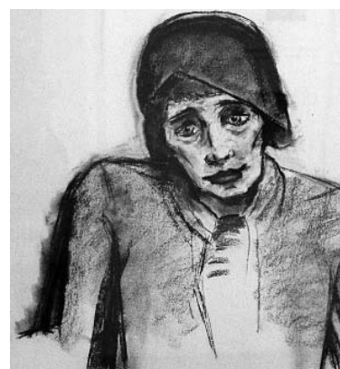
Ohne Titel (Frau mit Kappe), aus dem Jahr 1933.

Помимо светских женских портретов на выставке показаны волнующие изображения женщин в экстремальных ситуациях, например картина «Эмигрантка» 1933 года, будто уже предвкусывающая грядущий ужас национал-социализма. Иные картины посвящены скромному очарованию будничной жизни.