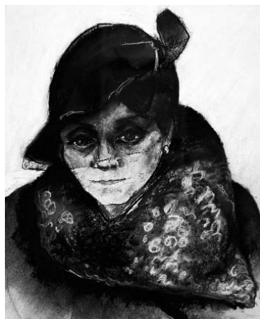
Emigrantin I, Pastellzeichnung, 1933.