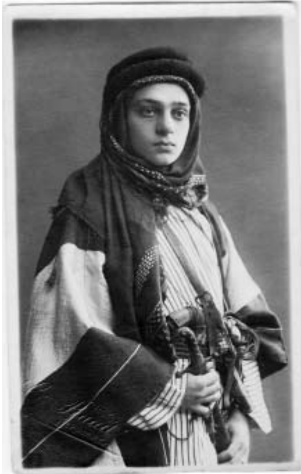
Jüdischer Junge als Scheich verkleidet, Purim 1922 in Jerusalem

Purim, das Fest, hat seinen Namen vom »Los«, vom Zufall des Glückspiels. Und viele »Zufälle« prägen