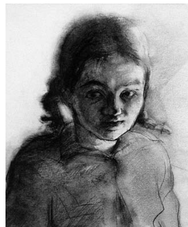
Junges Mädchen mit Zöpfen, 1934