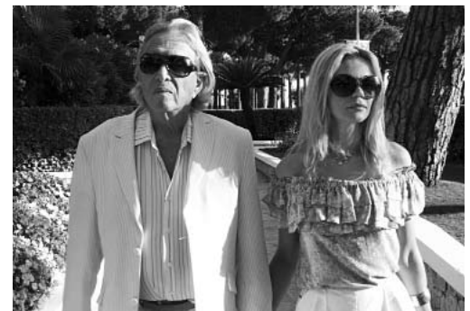
2 x Rolf Eden & Co. in »The Big Eden« von Peter Dörfler