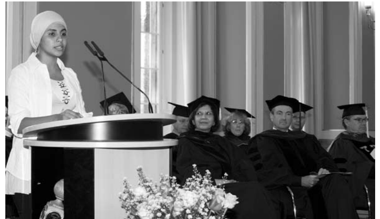
Das Touro College Berlin verabschiedet seine Studienabsolventen 2010 im Berliner Rathaus. Charlotte Knobloch, Präsidentin des Zentralrats der Juden in Deutschland, hat unlängst die Schirmherrschaft über die erste amerikanisch-jüdische Hochschule in Deutschland übernommen, die neben dem neuen »Master of Business Administration« auch die Studiengänge »Bachelor of Business Administration« und »Master of Holocaust Communication and Tolerance« anbietet.