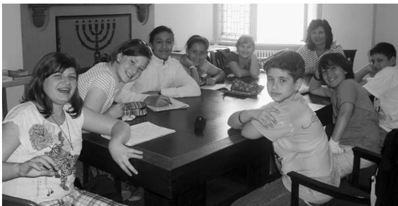
Die 5c bei der ihrer Projektarbeit für das »jüdische berlin«