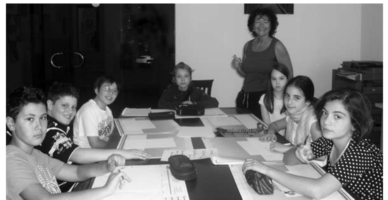
NADINE BOSE/NOGA HARTMANN