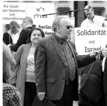
Solidaritätsdemonstration für Israel in Berlin im Juni

Zu einem anderen Schluss kommt die Jüdische Gemeinde zu Berlin: »Dieser Bundestagsbeschluss diene nicht der Entspannung des Nahost-Konflikts und hat die Lage Israels nicht ausreichend berücksichtigt«. ISABELLA NOBE