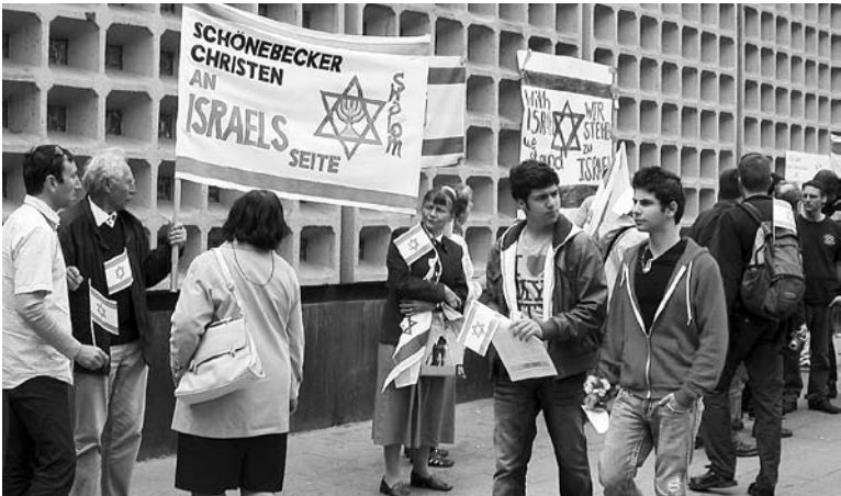
Israel-Solidaritätsdemonstration am 13. Juni am Berliner Breitscheidplatz SCH