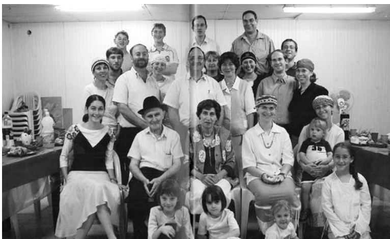
Nitzolim. Familienporträt Rubin

Организатор: Еврейская община Берлина, www.juedische-kulturtage.org