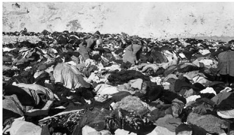
Nach dem Massaker von Babi Jar 1941

In den 1960ern wurde Babi Jar (auf Ukrainisch »Weiberschlucht«), »eingeebnet«: Sand und Erde mussten her,