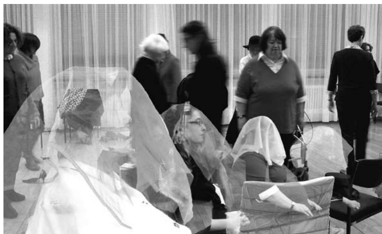
One Room of Memories (Videoausschnitt)