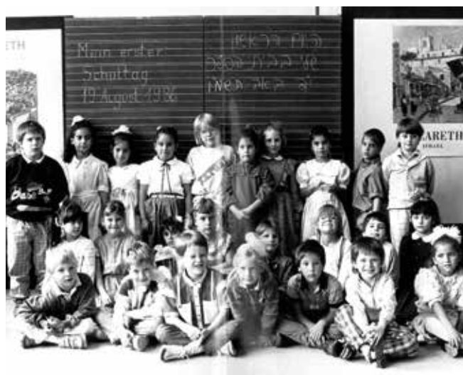
Herzlich Willkommen: Der erste Schultag am 19. August 1986

еся на поддержку мощного сообщества. Поколения учащихся научились здесь помнить о своих корнях и уверенно идти своим путем в будущее. Поэтому многие родители решают записать своих детей, окончивших Начальную школу им. Хайнца Галинского, в средние школы Еврейской общины Берлина. История Начальной школы им. Хайнца Галинского, которую в настоящее время посещают более 250 учащихся в 13 классах и в которой работают 49 учителей, воспитателей и других педагогических кадров, – это не только история создания школы, но и укрепления еврейской идентичности и еврейского сообщества в Берлине: тогда и сегодня.